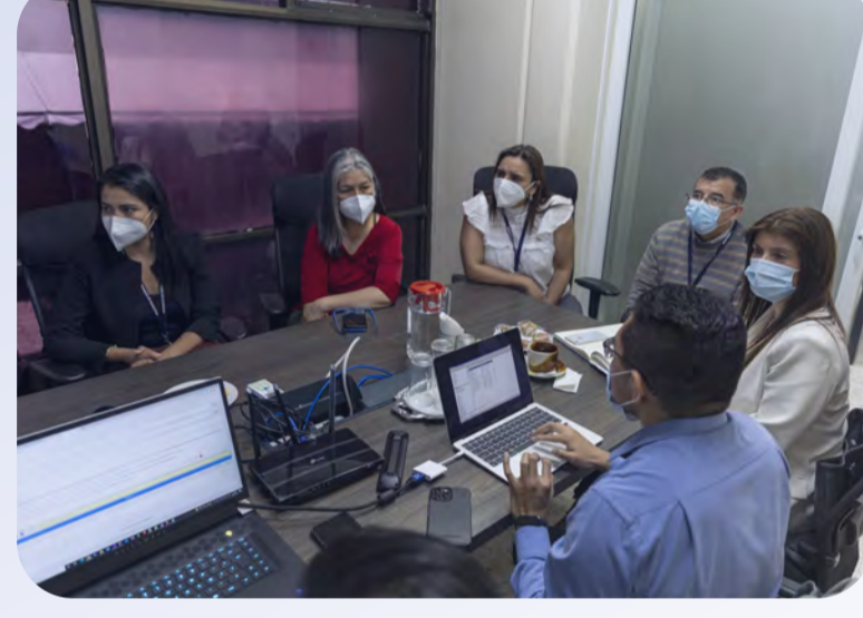
Autoridades del Registro de la Propiedad Intelectual y PRONACOM durante la presentación de los procesos de automatización en el Registro.